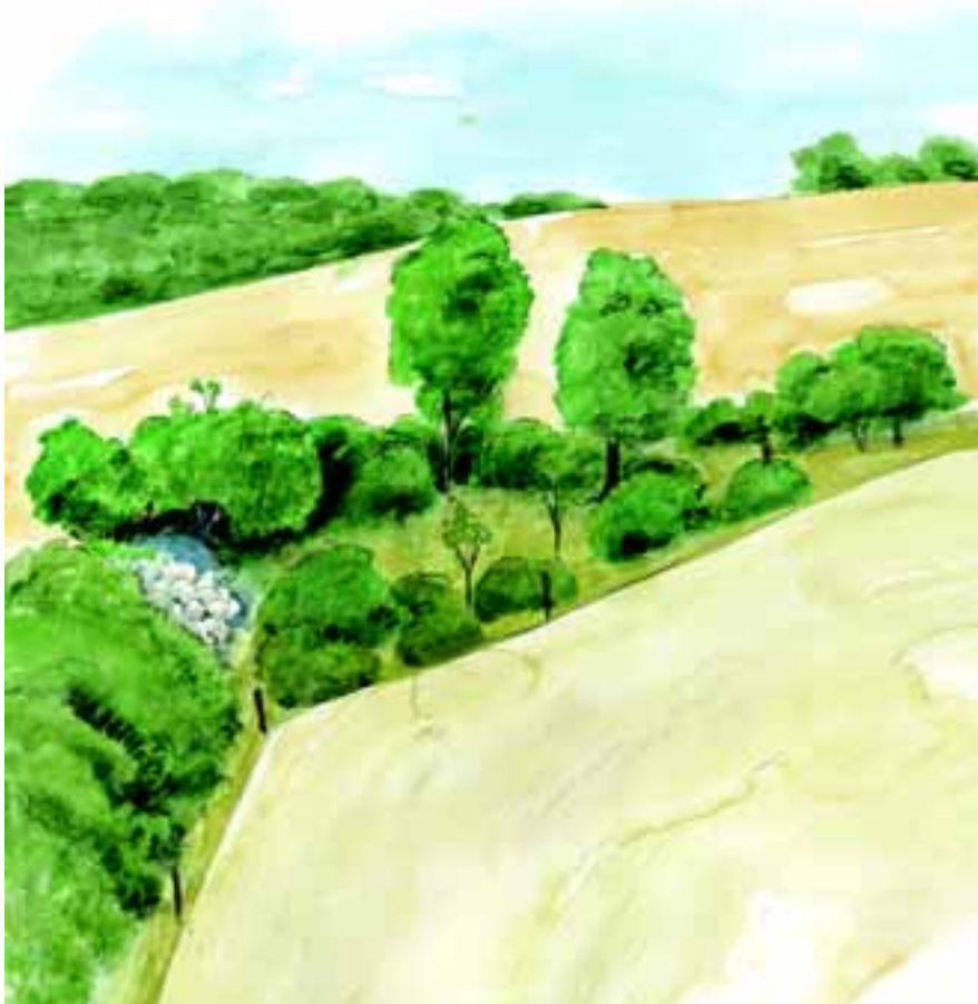
Den lille vildtplantning i et markhjørne

Arealkrav ved plantning i grupper med en rækkeafstand og en planteafstand på 1,5 meter x 1,5 meter: