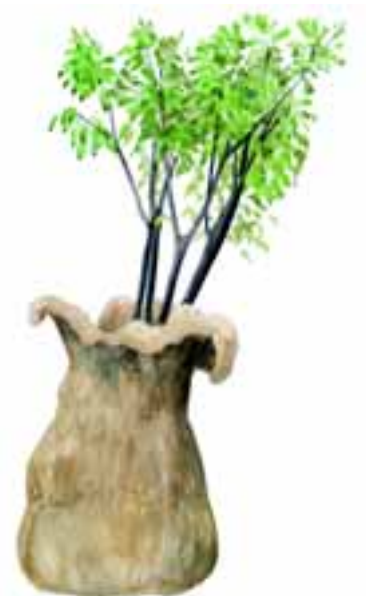
Opbevaring af planter i lærredssæk

træder jorden godt til omkring planten. Kontroller at planten sidder godt fast ved at trække forsigtigt i toppen af planten. Når du laver plantehullet, må du ikke vrikke med spaden, så du laver et timeglasformet hul. Så kan du ikke træde jorden ordentlig til omkring plantens rødder – der vil være luft omkring rødderne – og planten vil dø.