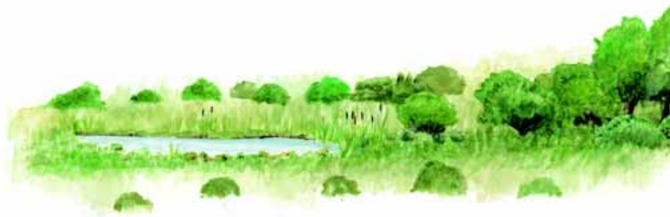
Et godt vandhul (åbent, flade bredder m.m.)

Hvis formålet med ens vandhul er at skabe de bedste betingelser for vandfugle, padder og insekter, bør man helt undlade plantning omkring vandhullet.