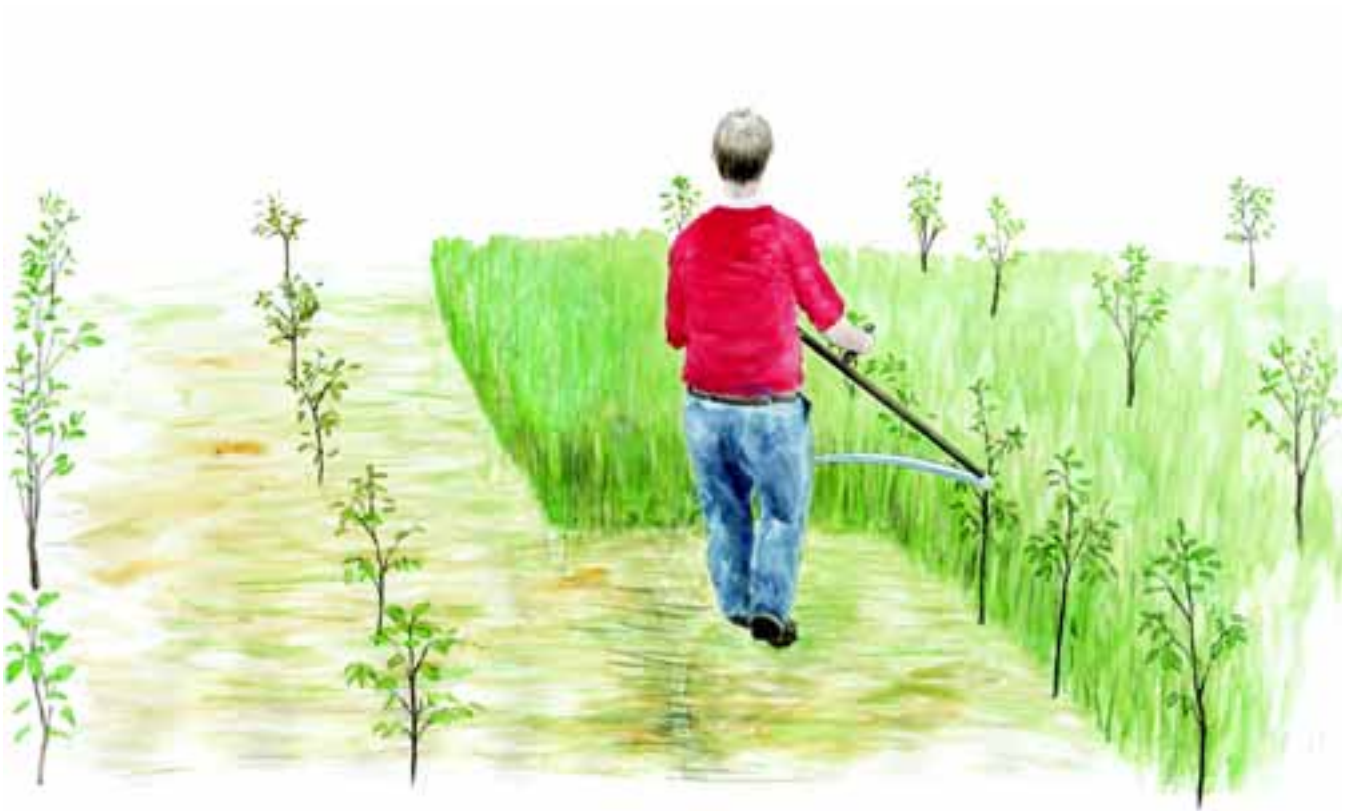
Slåning af ukrudt med le

planterne skal mellemrummet uden tænder – midt på harven – være ca. 30 cm. Afhængig af planternes vækst vil du, uden at skade planterne, kunne renholde plantningen i et par år. En gammel harve med gåsefodstænder er fortrinlig til formålet. For begge metoder gælder, at jorden minimum skal behandles en gang i hver retning i række-mellemrummet. Ved renholdelse med traktor betyder det, at du skal køre hen over hver række en gang.