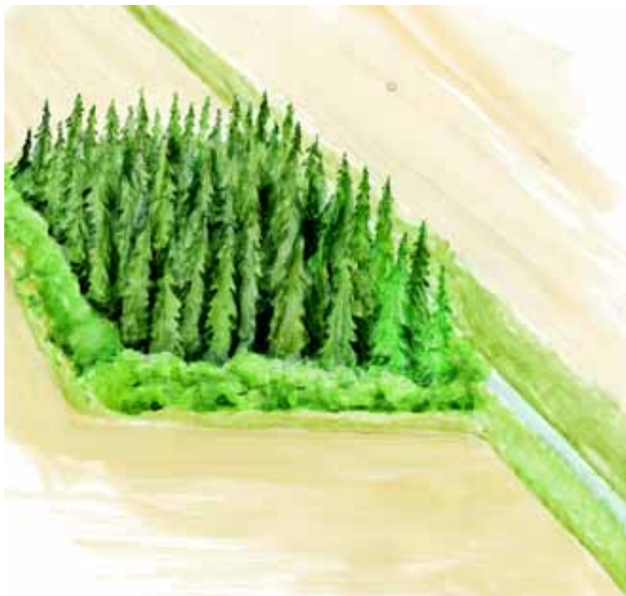
Dårlig designet remise

I planlægningsfasen skal man overveje renholdelsesmetoden . Dette har særlig betydning for rækkeafstanden.