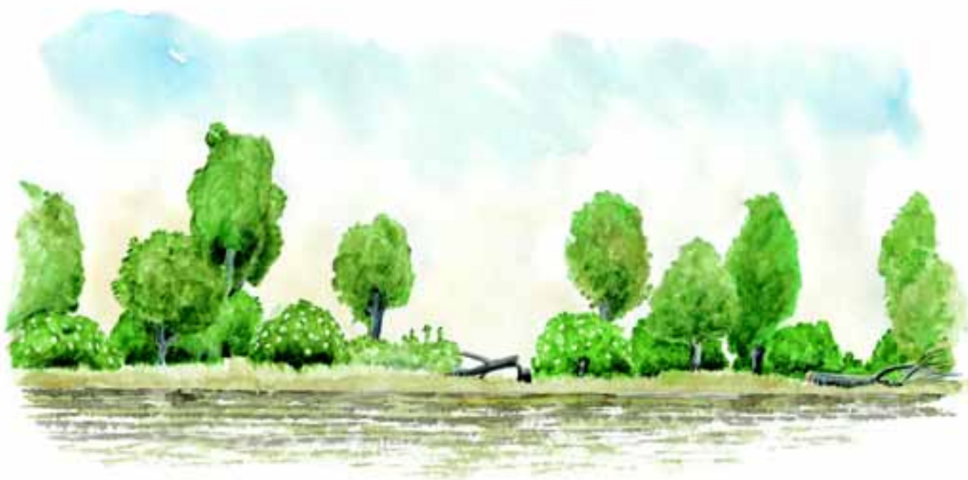
Tynding af hegn, nogle træer og buske „halvfældes“

Du kan også foretage en topkapning af nåletræerne i 1,5-2 m højde. Dette skal gøres endnu mens træerne har grønne grene ved jorden. Du må påregne at skulle gentage topkapninger hvert eller hvert andet år, idet den øverste grenkrans vil forsøge at danne 3-4 nye toppe.