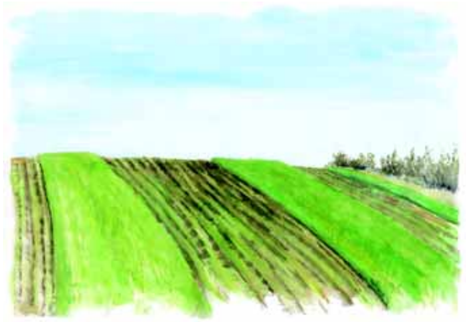
Vildtstriber i brakmark

Hvis brakarealet i stedet bliver fordelt i 20 meter brede brakstriber over hele ejendommen, som reglerne giver mulighed for, vil der være en rand på 3000 meter. Vildtet vil i dette tilfælde have hele 36 ha til rådighed.