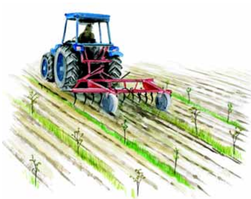
Renholdelse med traktor og harve

Du kan med fordel renholde din plantning ved jordbearbejdning. Jordbearbejdningen skal foretages så ofte, at der ikke dannes store græstotter eller et tæt dække af græs. I modsat fald bliver jord-