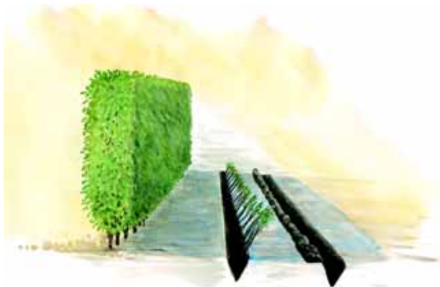
Planter i indslag i skygge bag hæk eller hegn

Du får planterne leveret i en 3-lags papirsæk. Hvis sækken holdes uåbnet , og stilles køligt og i skygge , kan planterne opbevares i sækken i 2-3 uger. Hvis du lukker sækken op ved leveringen for at kontrollere leverancen, skal du være opmærksom på, at lukke sækken korrekt. Det inderste lag lukkes først. Herefter skal du lukke det yderste lag oven over den inderste lukning. På den måde har du to uafhængige lukninger af sækken. Vandtabet fra planterne i sækken vil være minimalt. Du skal selvfølgelig undgå at lave huller i sækken. Hvis sækken går i stykker, eller hvis du først planter mere end 2-3 uger efter modtagelsen, skal planterne "slåes ind" ved, at der graves en rende i mindst et spadestiks dybde på et køligt og skyggefuldt sted. Plantebundterne åbnes, og planterne fordeles, så de alle kan få direkte